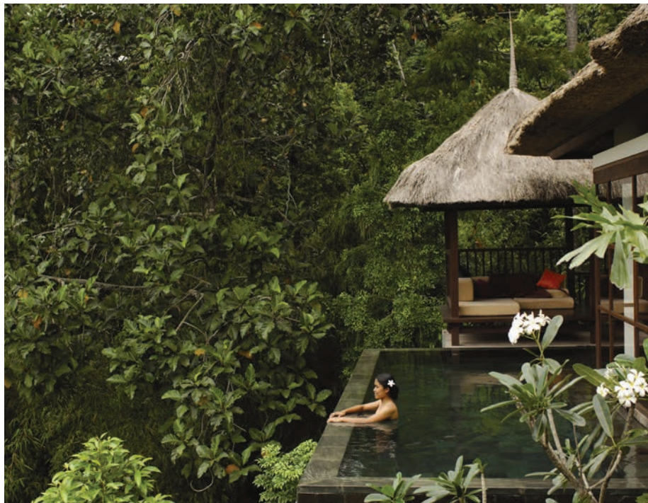
Ubud Hanging Gardens

Ako želite doživjeti nešto posebno, potpuno drugačije, odvažite se na dalek put do Balijsa. Vesela nasmijana lica srdačnih ljudi, prekrasna priroda, šarolik životinjski svijet i kulturne zanimljivosti pružit će vam potpuno novo iskustvo. S obzirom na povoljne cijene smještaja, toplo more i lijepo vrijeme, Bali je tijekom ljetnih mjeseci vrlo tražena destinacija. Odmorite se na pješčanim plažama, razgledajte hramove, uživajte u pogledu na zelena rižina polja, razgovarajte s papigama, uhvatite velikog šišmiša i potpuno se prepustite čarima prirodnih ljepota. Od svibnja put za Bali postaje ugodniji, letite s Qatar Airwaysom iz Zagreba. info@travelsinstyle.hr www.travelsinstyle.hr